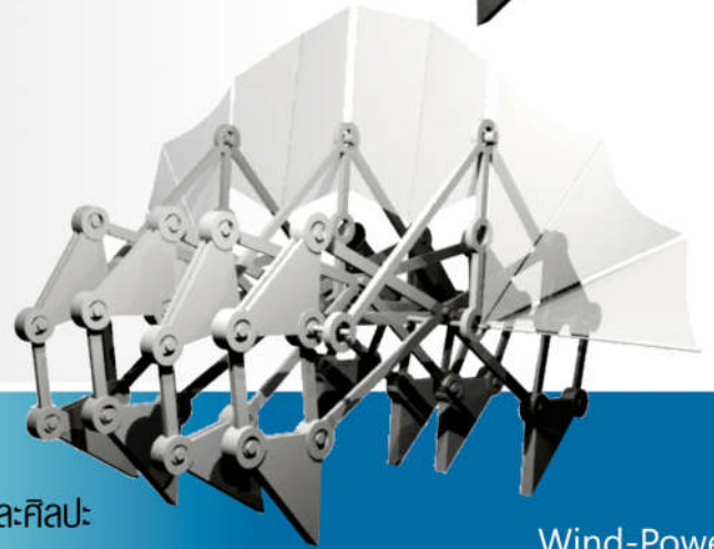
Wind-Powered Walking Monster